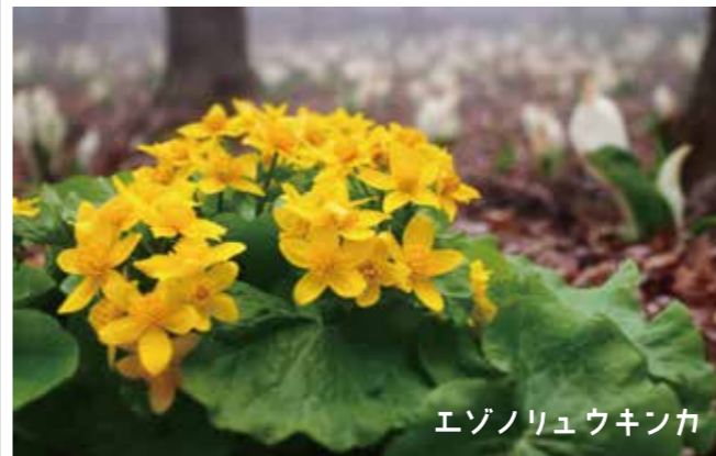
エゾノリュウキンカ