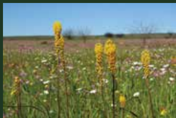
ブルビネラ・ラティフォリア Bulbinella latifolia