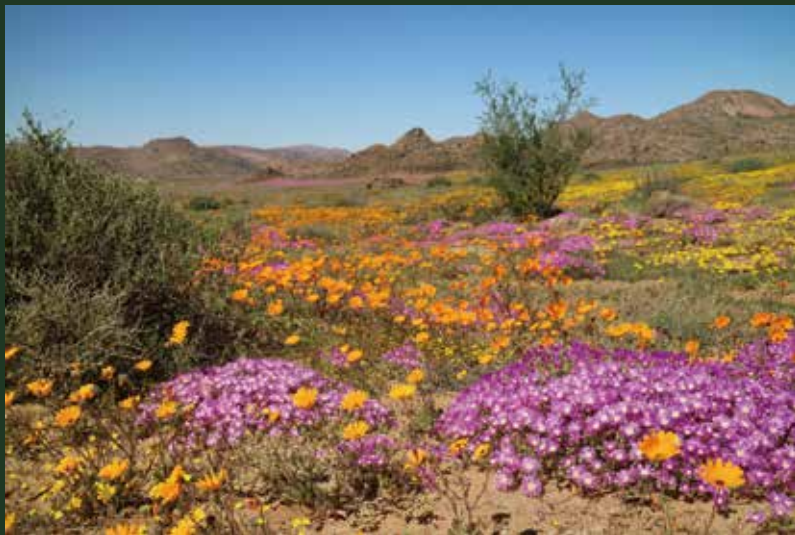
球根植物の宝庫 ナマクアランドの風景