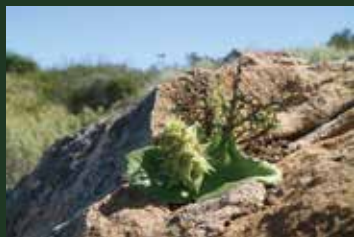
マッソニア・ピフォリア Massonia bifolia