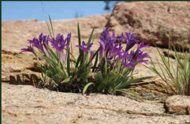
バビアナ・ドレゲイ Babiana dregei

特異な花色や草姿が魅力の「南アフリカの球根植物」のうち、春に開花するもの（モラエア、ラケナリア、ラペイロージア、ロムレア、アルブカ等）を中心に約30点展示します。