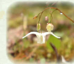
キバナイカリソウ