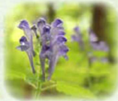
オカタツナミソウ