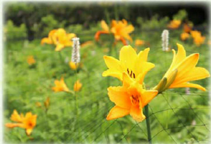
トビシマカンゾウ

梅雨入り前のしっとりとした空気に包まれた園内では、町の花に指定されているサンショウバラを見ごろを迎えています。また、トビシマカンゾウやイブキトラノオが美しく咲き誇り、園内を彩っています。アヤメやカキツバタ、ハマナスも咲き始め、落ち着いた雰囲気の中で初夏ならではの花々をご覧ください。