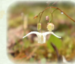
キバナイカリソウ