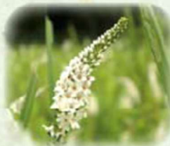
イヌヌマトラノオ