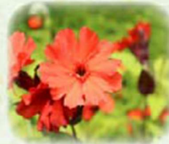
マツモトセンノウ