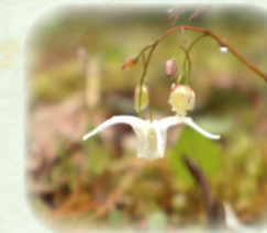
キバナイカリソウ