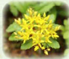
エゾノキリンソウ