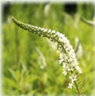
イヌヌマトラノオ