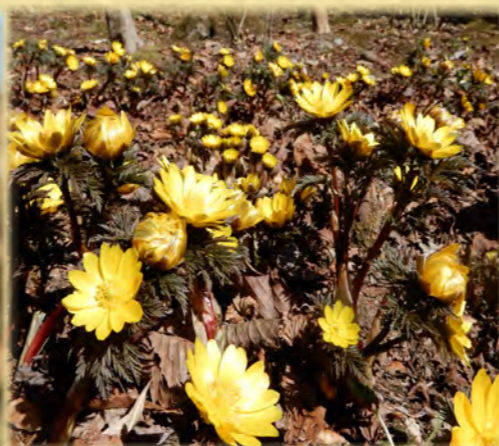
フクジュソウ 福寿草 キンポウゲ科 観察エリア・岩場植物区