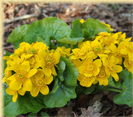
エゾノリュウキンカ 蝦夷立金花 キンポウゲ科 観察エリア・湿生林の植物