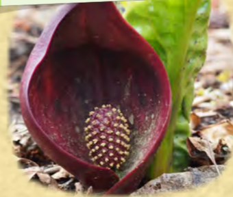
ザゼンソウ 座禅草