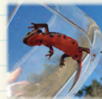
(おなかは赤く目立つ)

アカハライモリが、春の陽気を感じて冬眠から目覚めました。園内では、池の底でじっと静止している姿を見ることができます。危険を感じると体をねじり派手な色のおなかを見せて威嚇します。