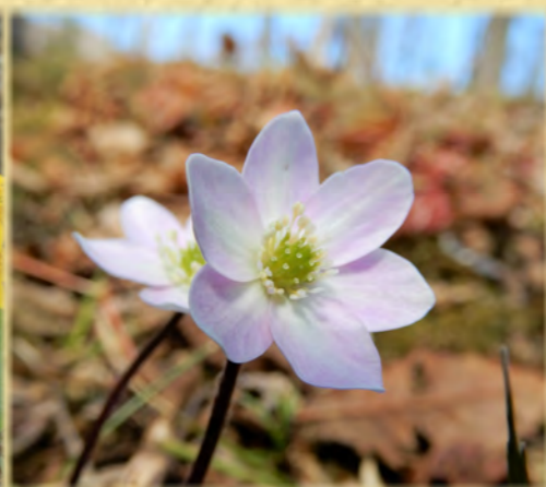
ミスミソウ 三角草 キンポウゲ科 観察エリア・落葉広葉樹林の植物