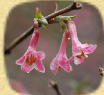
ウグイスカグラ 鶯神楽