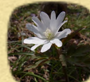
キクザキイチゲ 菊咲一華

箱根湿生花園は、早春の花々の目覚めに合わせ、3/20より開園いたします。 今年の水芭蕉の見ごろは、3月下旬から4月初旬の予定です。