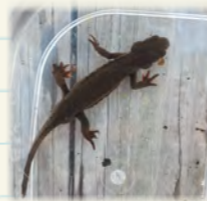
アカハライモリ(雄)