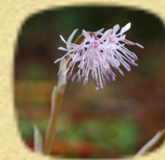
ショウジョウバカマ 猩々袴