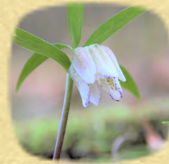
コシノコバイモ 越の小貝母