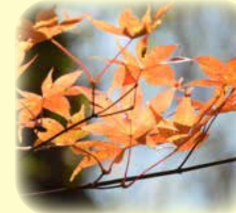
オオモミジ 大紅葉