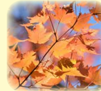
コミネカエデ 小峰楓

仙石原では、霜が降りるようになり落ち葉舞う季節となりました。園内の紅葉も終盤を迎え、イロハモミジやオオモミジが色づいています。花だよりは、本号(24号)をもって今季最終号となります。一年間ありがとうございました。