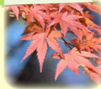
イロハモミジ いろは紅葉