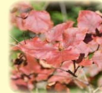
オンツツジ 御躑躅