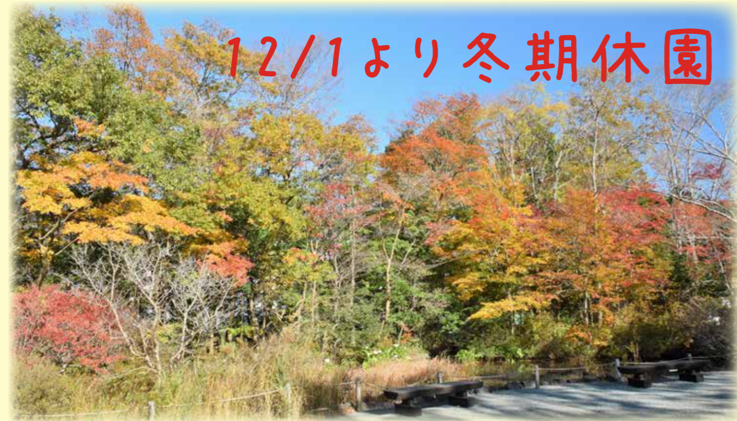
サービスガーデンの紅葉の様子

仙石原では、霜が降りるようになり落ち葉舞う季節となりました。園内の紅葉も終盤を迎え、イロハモミジやオオモミジが色づいています。花だよりは、本号(24号)をもって今季最終号となります。一年間ありがとうございました。