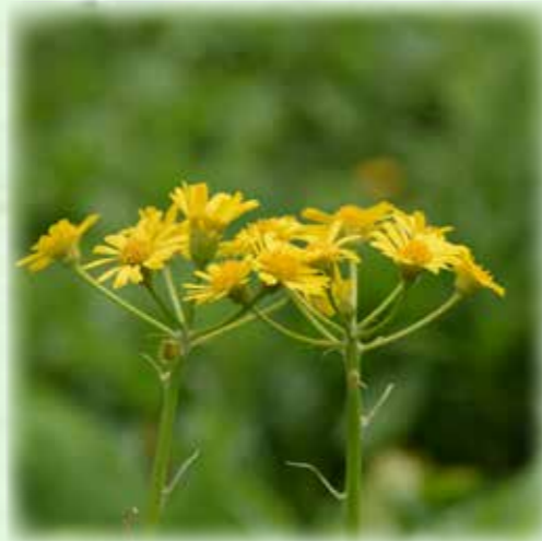
サワオグルマ 沢小車 キク科 観察場所:⑥