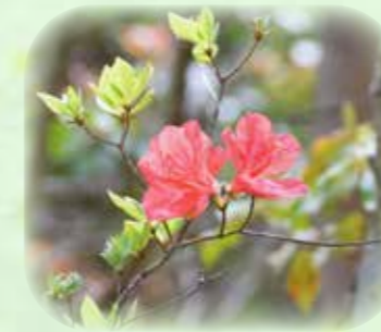
ヤマツツジ 山躑躅 観察場所:①