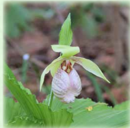
クマガイソウ 熊谷草 ラン科 観察場所:④