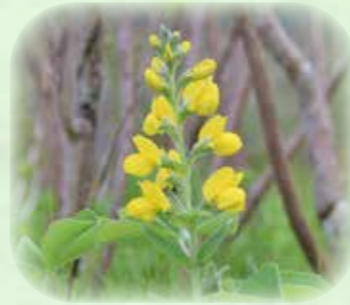
センダイハギ 先代萩 観察場所:④