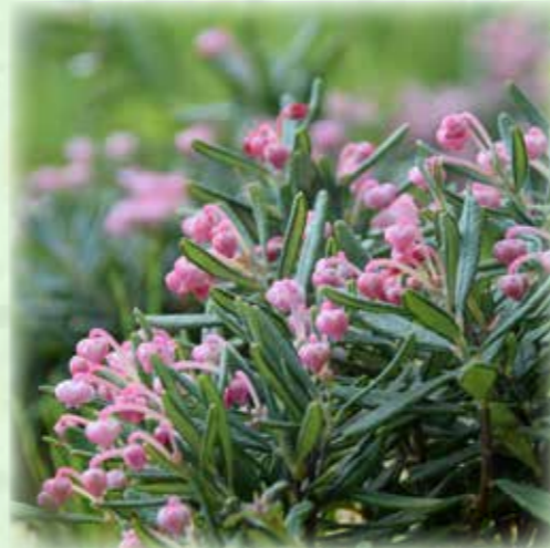
ヒメシャクナゲ 姫石楠花 ツツジ科 観察場所:⑥