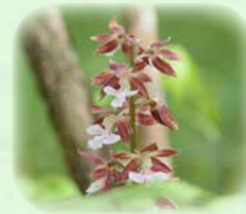
エビネ 海老根 観察場所:サ、①、岩