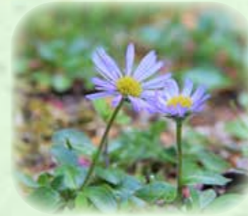
ミヤマアズマギク 深山東菊 観察場所:⑤