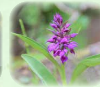
ハクサンチドリ 白山千鳥 観察場所:⑤