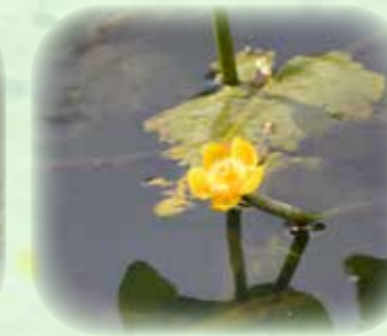
コウホネ 河骨 観察場所:④、⑦