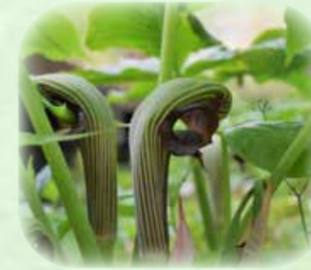
ムサシアブミ 武蔵鎧 観察場所:サ、③、⑧