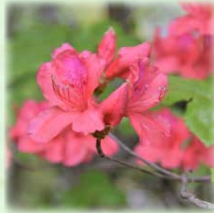
オンツツジ 雄躑躅 ツツジ科 観察場所:⑤