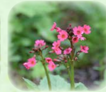
クリンソウ 九輪草 観察場所:③、岩