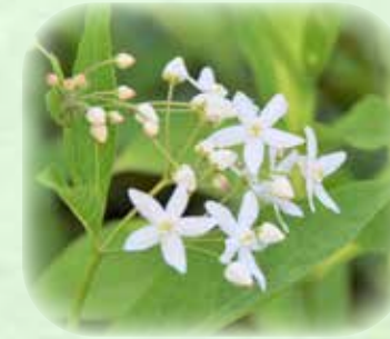
クサタチバナ 草橘 観察場所:②