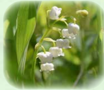
スズラン 鈴蘭 観察場所:②