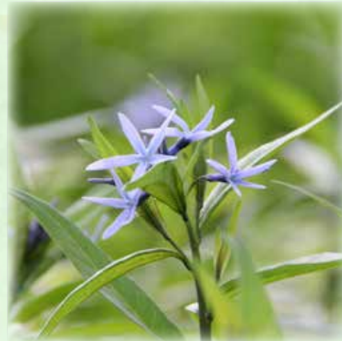
チョウジソウ 丁字草 キョウチクトウ科 観察場所:③