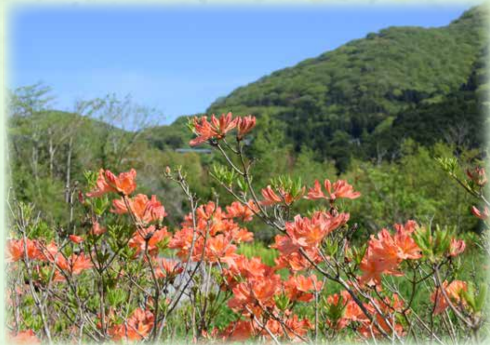
レンゲツツジ 蓮華躑躅 ツツジ科 観察場所:④

初夏に入り、園内では、レンゲツツジやクリンソウといった、色鮮やかな花が目立つようになりました。5月の心地よい青空の下、高山のお花畑区では、エゾルリソウやヒオウギアヤメ、ミヤマキリシマ、クロユリなど、様々な高山植物が見頃となっています。