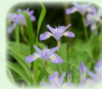
ヒメシャガ 姫射干 観察場所:岩