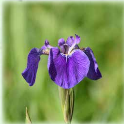
ヒオウギアヤメ 檜扇菖蒲 アヤメ科 観察場所:④、⑤、⑥