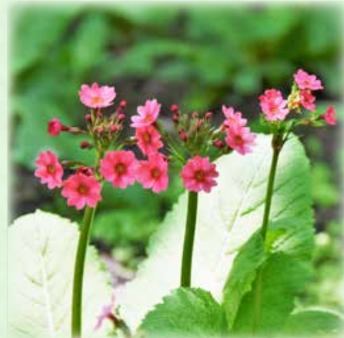
クリンソウ 九輪草 サクラソウ科 観察場所:③、岩