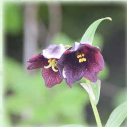
クロユリ 黒百合 ユリ科 観察場所:⑤