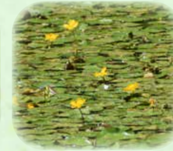
アサザ 苎・浅沙 観察場所:③