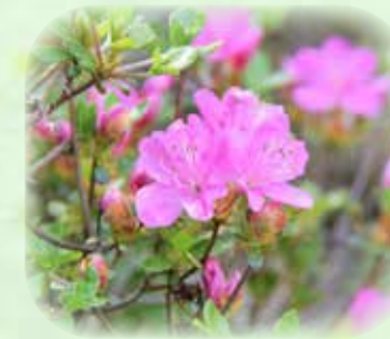
ミヤマキリシマ 深山霧島 観察場所:⑤