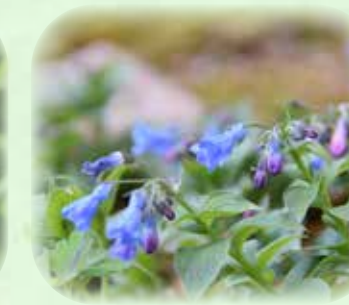
エゾルリソウ 蝦夷瑠璃草 観察場所:⑤