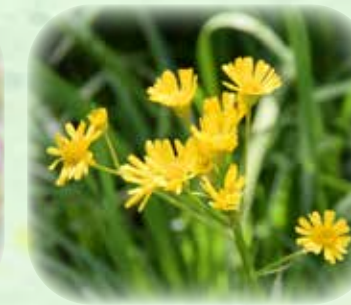
サワオグルマ 沢小車 観察場所:③、⑥