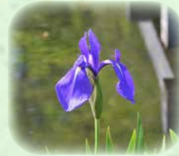
カキツバタ 杜若 観察場所:④、⑧