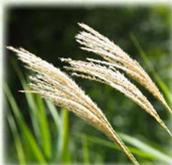
草原では、ススキの穂が目立つように!