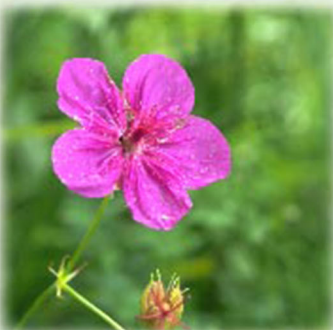
アサマフウロ 浅間風露 フウロソウ科 観察場所:④、⑥

コマツナギ、コムラサキ、サツマハギ、ハナツクバネウツギ、ノブドウ、マキエハギ、ムクゲ など