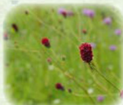
ワレモコウ 吾亦紅 観察場所:園内各所