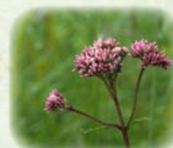
サワヒヨドリ 沢鞠 観察場所:②、植