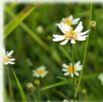
サワシロギク 沢白菊 キク科 観察場所:④、⑥、⑦