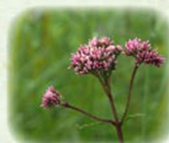
サワヒヨドリ 沢鴉 観察場所: ②、植