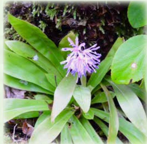
ショウジョウバカマ