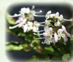
ホツツジ 穂薺薺 観察場所: ②、⑤