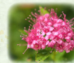
シモツケ 下野 観察場所: 園内各所