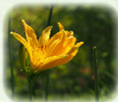
トビシマカンゾウ