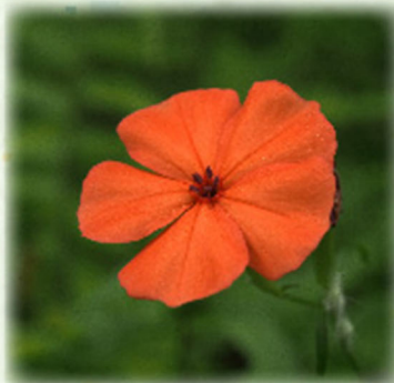
フシグロセンノウ