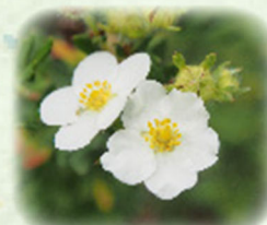
ハクロバイ 白露梅 観察場所: ⑤