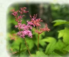
コシジシモツケソウ 越路下野草 観察場所: ④、岩