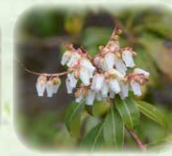
アセビ 馬酔木 観察場所:サ、①、岩、⑥、⑦ 見頃:3月~4月