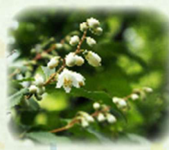
ウツギ 空木 観察場所: ②