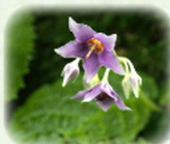
ケイワタバコ 毛岩煙草 観察場所: 岩