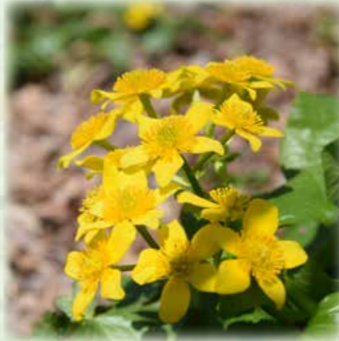
エゾノリュウキンカ 蝦夷の立金花 キンポウゲ科 観察場所:③、⑧ 見頃:4月

観察場所記号 サ:サービスガーデン ①:落葉広葉樹林区 ②:ススキ草原区 ③:低層湿原区 ④:ヌマガヤ草原区 ⑤:高山のお花畑区 岩:岩場植物区 ⑥:高層湿原区 ⑦:仙石原湿原区 ⑧:湿生林区 植:植生復元区