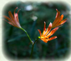
キツネノカミソリ