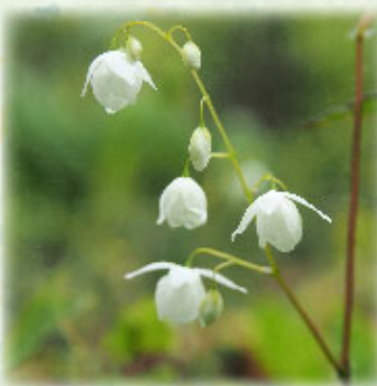
バイカイカリソウ