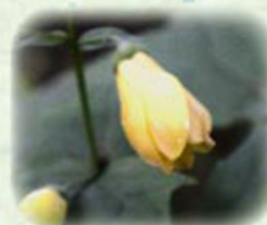
キレンゲショウマ 黄蓮華升麻 観察場所: ⑤