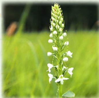
ミズチドリ 水千鳥 ラン科 観察場所: 植