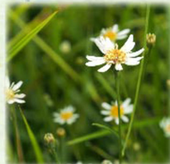
サワシロギク 沢白菊 キク科 観察場所: ④、⑥、⑦