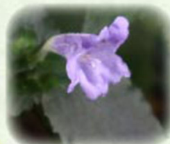
スズムシバナ 鈴虫花 観察場所: ③、⑤