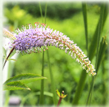
クガイソウ 九蓋草、九脂草 オオバコ科 観察場所: ③、④、⑤