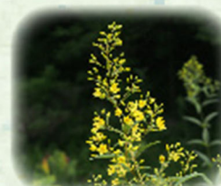
クサレダマ 草連玉 観察場所: 園内各所