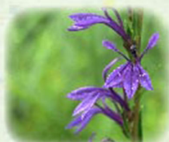
サワギキョウ 沢桔梗 観察場所: ⑦、植