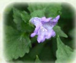
スズムシバナ 鈴虫花 観察場所: ③、④