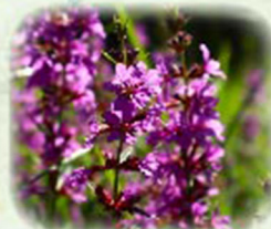
ミソハギ 縹菘 観察場所: 園内各所