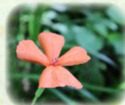
フシグロセンノウ 節黒仙翁 観察場所: ①、②