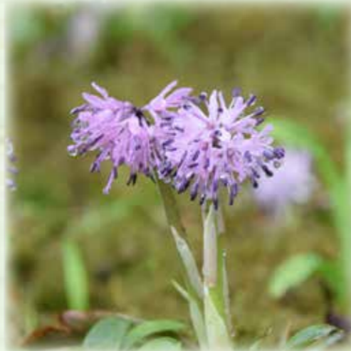
ショウジョウバカマ 猩々袴 シュロソウ科 観察場所:サ、④、⑤、岩 見頃:3月~4月