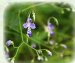
カリガネソウ 雁草 観察場所: 岩