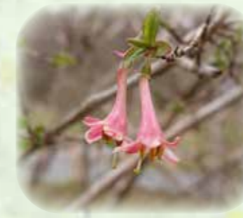
ウグイスカグラ 鶯神楽 観察場所:①、②、岩 見頃:3月~4月