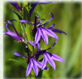
サワギキョウ 沢桔梗 キキョウ科 観察場所: ⑦、植