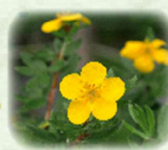
キンロバイ 金露梅 観察場所: ⑤