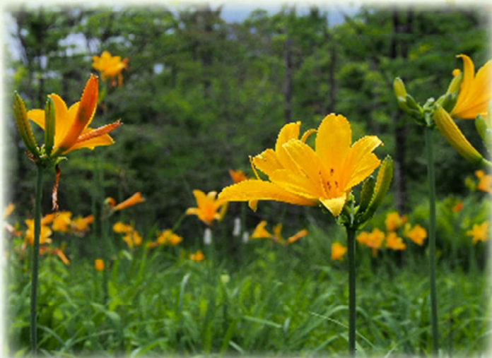
トビシマカンゾウ

爽やかな初夏を迎え、一雨ごとに緑が深みを増しております。湿原では、トビシマカンゾウやイブキトラノオがお花畑をつくり、箱根町の花に指定されているサンショウバラも咲き始めています。ハマナスやアヤメなど、色とりどりの花が咲き誇る園内では、花蜂が花から花へ、せわしなく飛び回り、花の蜜を集める様子を楽しめます。