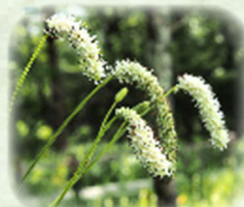
ナガボノシロワレモコウ