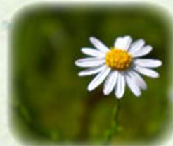
ユウガギク 柚香菊 観察場所: 園内各所