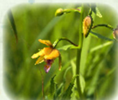
カキラン 栴蘭 観察場所: ⑦