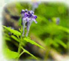
オカタツナミソウ