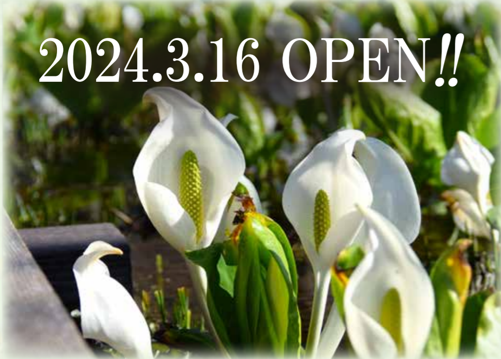
ミズバショウ 水芭蕉 サトイモ科 観察場所:③、⑤、⑥、⑧ 見頃:3月~4月