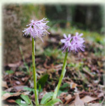
ショウジョウバカマ