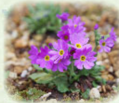
ユキワリコザクラ