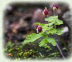
アズマシロカネソウ