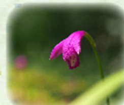
サワラン 沢蘭 観察場所: ⑥