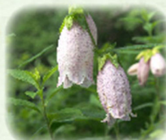
ヤマホタルブクロ