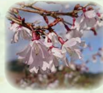
マメザクラ 豆桜 観察場所:サ、③、⑥、⑧ 見頃:4月