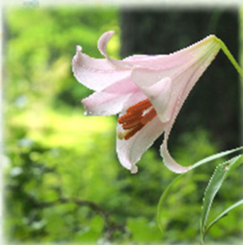
ササユリ 笹百合 ユリ科 観察場所: ①