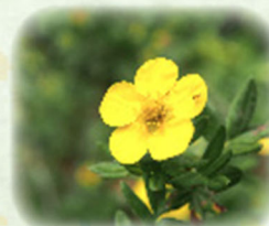
キンロバイ 金露梅 観察場所: ⑤