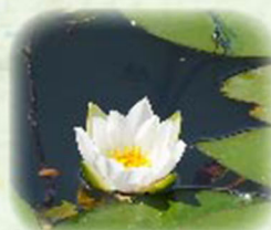
ヒツジグサ 未草 観察場所: ⑦