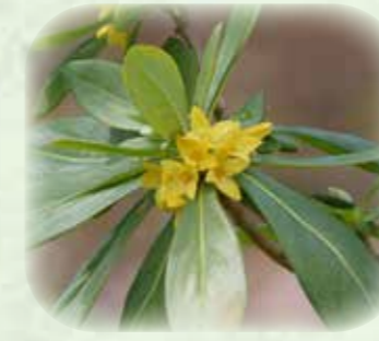
ナニワズ 難波津 観察場所:① 見頃:3月