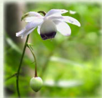
レンゲショウマ 蓮華升麻 キンボウゲ科 観察場所: ①、③

見頃の花をご紹介しながら、園内を約90分で回ります。 ○午前の部 10時~ ○午後の部 13時~ 受付: 当日窓口にて 定員: 各回10名 参加費無料(別途入園料が必要) 定休日: 園内ガイドは、毎週木曜日がお休みとなります。