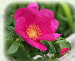
ハマナス 浜梨 観察場所: ④、⑤