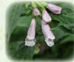
ジャコウソウ 麝香草 観察場所: ⑤