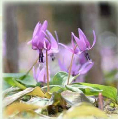
カタクリ 片栗 ユリ科 観察場所:①、岩 見頃:3月~4月