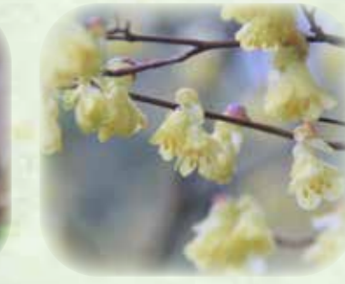
ヒュウガミズキ 日向水木 観察場所:サ、② 見頃:3月~4月