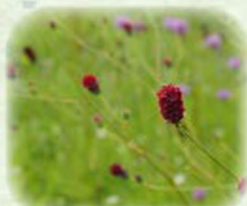
ワレモコウ 吾亦紅 観察場所: 園内各所