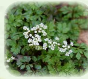
セントウソウ 仙洞草 観察場所:③、⑧ 見頃:3月~4月

観察場所記号 サ:サービスガーデン ①:落葉広葉樹林区 ②:ススキ草原区 ③:低層湿原区 ④:ヌマガヤ草原区 ⑤:高山のお花畑区 岩:岩場植物区 ⑥:高層湿原区 ⑦:仙石原湿原区 ⑧:湿生林区 植:植生復元区