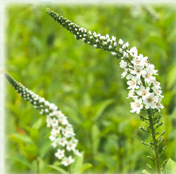
イヌヌマトラノオ 犬沼虎の尾 サクラソウ科 観察場所: ②、植