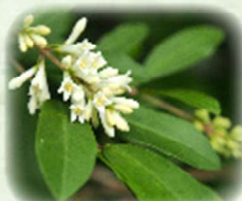
イボタノキ 水蛭の木 観察場所: 園内各所