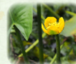
コウホネ 河骨 観察場所: ④、⑦