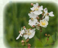
ノイバラ 野茨 観察場所: ②、⑦