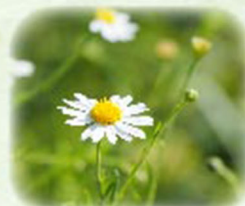
ユウガギク 袖香菊 観察場所: 園内各所