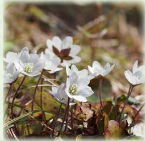
ミスミソウ 三角草 キンポウゲ科 観察場所:①、岩 見頃:3月