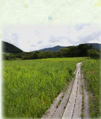
植生復元区の様子