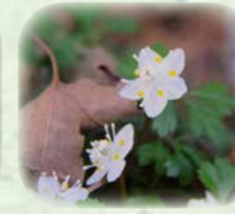
バイカオウレン 梅花黄連 観察場所:⑤ 見頃:3月