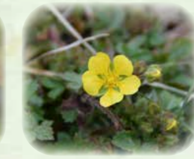
キジムシロ 雉薔 観察場所:② 見頃:3月~4月