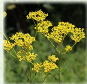
オミナエシ 女郎花 オミナエシ科 観察場所: ②、植