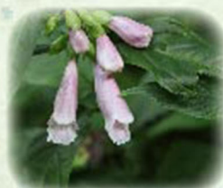
ジャコウソウ 麝香草 観察場所: ⑧