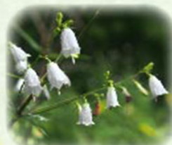
ツリガネニンジン 釣鐘人參 観察場所: ②