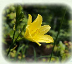
エゾキスゲ 蝦夷黄薔 観察場所: ④