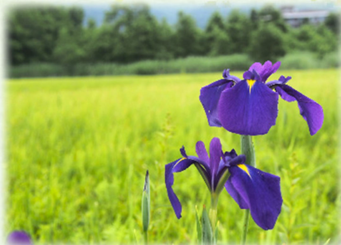
ノハナショウブ 野花菖蒲 アヤメ科 観察場所: ④、⑥、⑦、植

本格的な梅雨に入り、雨や霧の日が続くようになりました。霧に包まれた湿原では、点々と咲くノハナショウブが幻想的な風景を作り出しています。たっぷりの雨に、絶滅危惧種にも指定されている野生ランのミズチドリも咲き始めました。