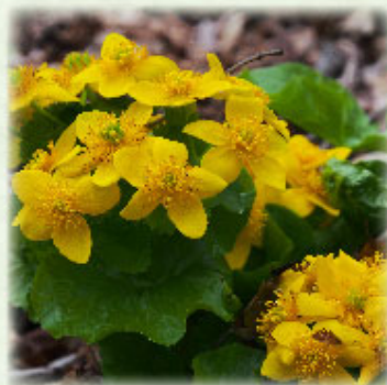
エゾノリュウキンカ