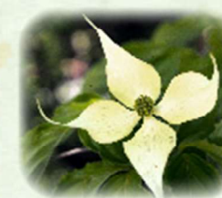
ヤマボウシ 山法師 観察場所: サ、①