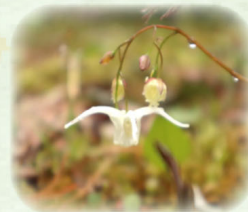
キバナイカリソウ