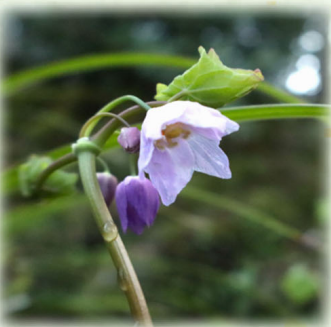
トガクシショウマ