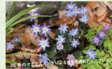
200株のオオミスミソウによる自生地再現ディスプレイ!