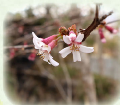
オクチョウジザクラ