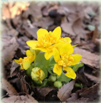
エゾノリュウキンカ