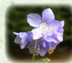
エゾノハナシノブ